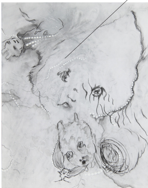
Christian Lhopital, extrait de la série Dessins Fabuleux , poudre de graphite 65 cm x 50 cm, centre d'art du Pavillon Blanc, 2020