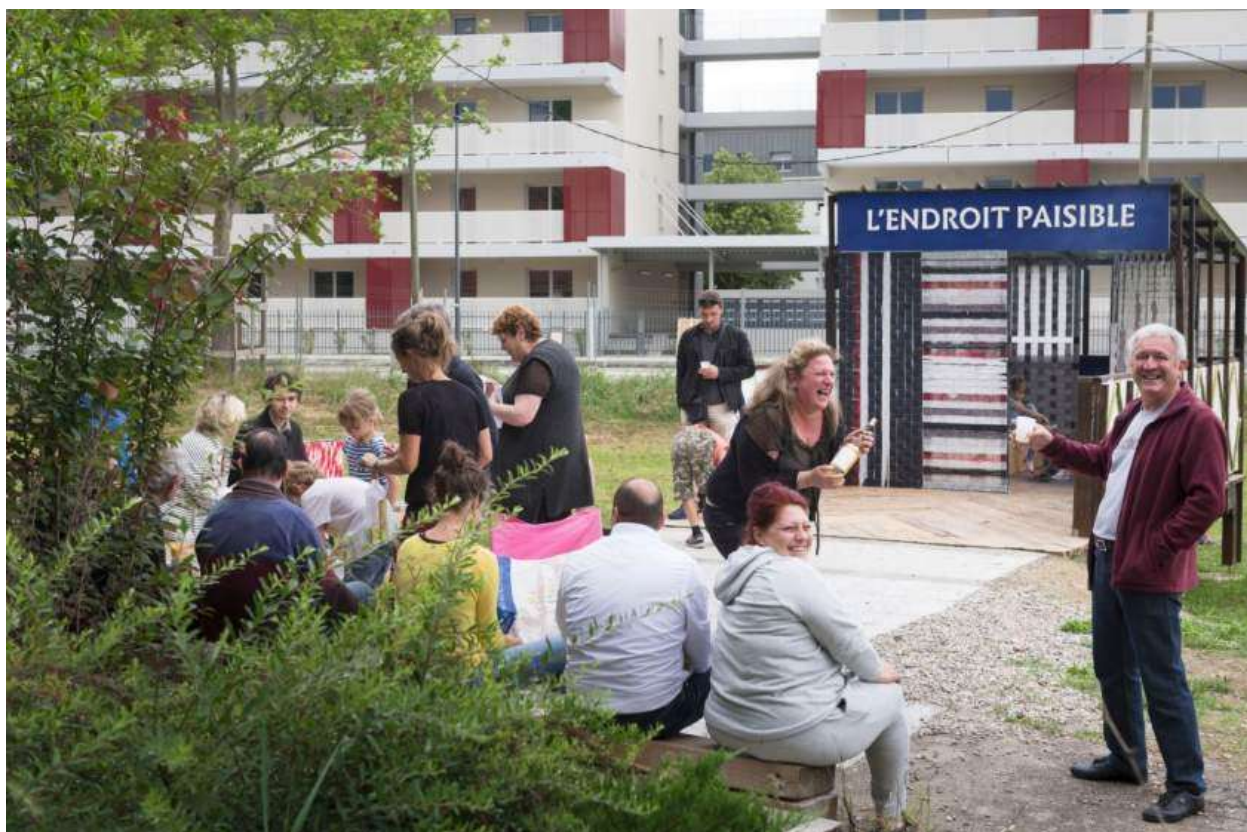
Moment partagé lors de la résidence du printemps 2017 autour du « lieu passager », renommé « endroit paisible » par les habitants