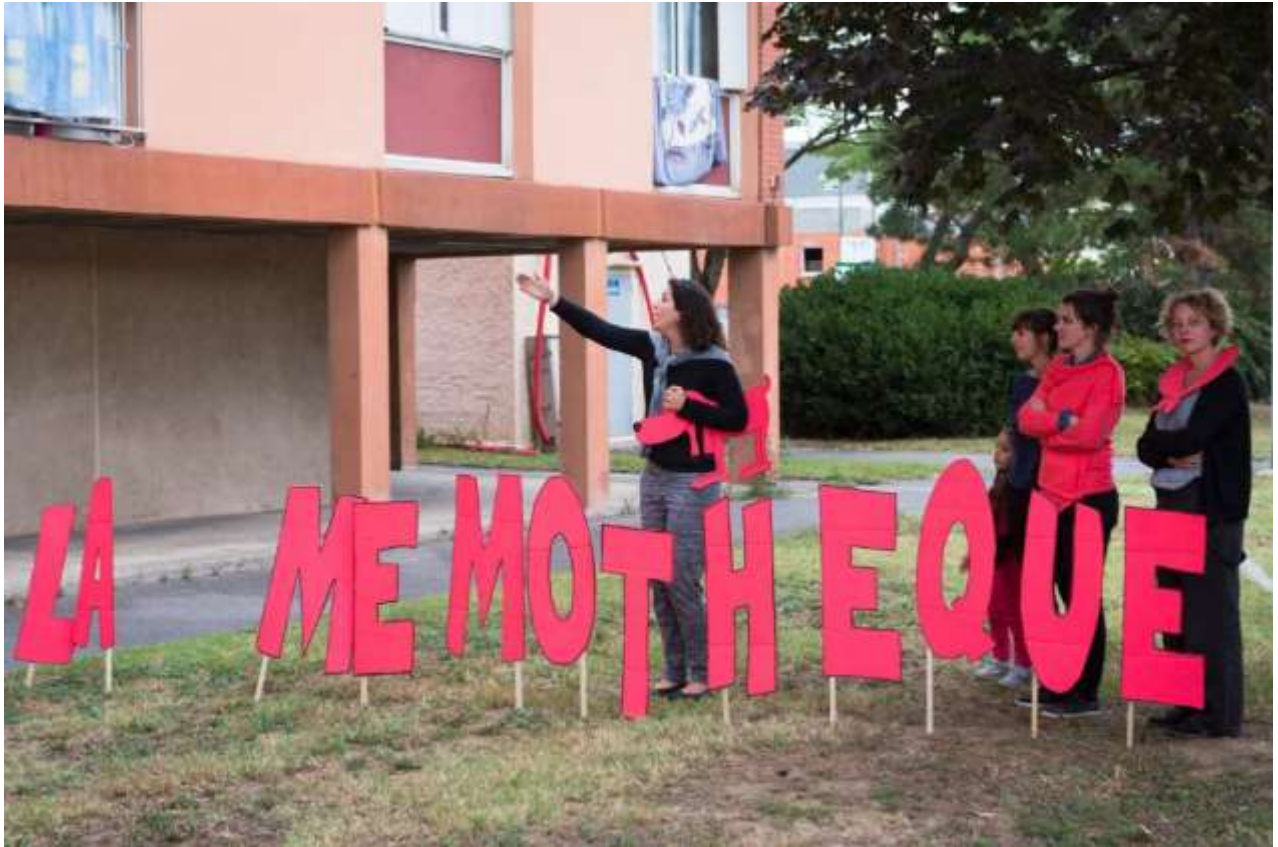
Spectacle déambulatoire, clôture résidence des Bruits qui courent , « On était chaud ! » 17 septembre 2016