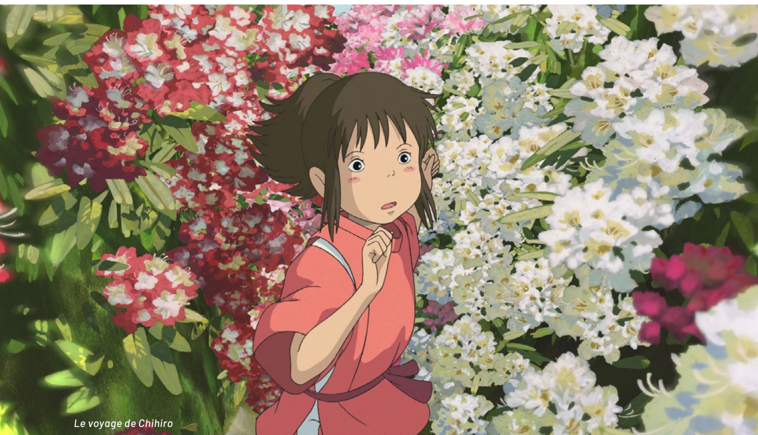
Le voyage de Chihiro